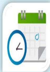
Agenda tu cita