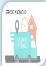
Servicio a Domicilio